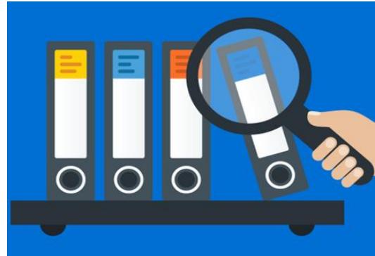
Préparation Audit Orga